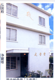
屋内納骨堂「之音堂」